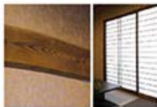
古樹と桐子/長い 年月を経た素材は 風情あふれた存在 感があります。桐子 は換気扇を採 用しました。

隅々まで和の気感を広げていくように素材を厳選しました。歳で使われていた素材を壁に貼り室内のアセントに利用。江戸時代から遊ばれてきた持ち味が和室に深みを加えています。美意識のもと誕生した当社のオリジナルの塗り壁(花びら)や収納器具の太鼓張りなどの伝統的な技法も採用。新しい住まいであるにも関わらず成熟した美しさを演出しています。