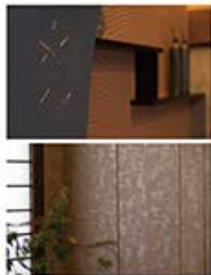
塗り壁(花びら)と木調調り/塗り壁は 暖かみのある素材が独特の印象を与え てくれます。そして、木調調りの壁紙は 空間をより引き立ててくれます。